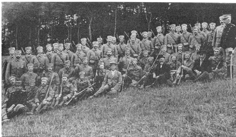
Efter endt øvelse.

Og Vejle Amts Rekylkorps var bare et af de 20 korps, som hørte under Centralkomiteen for De frivillige Korps ... bogen er således fyldt med beretninger og anekdoter, som det ikke er svært at nikke genkendende til som tidligere hjemmeværnsmand.