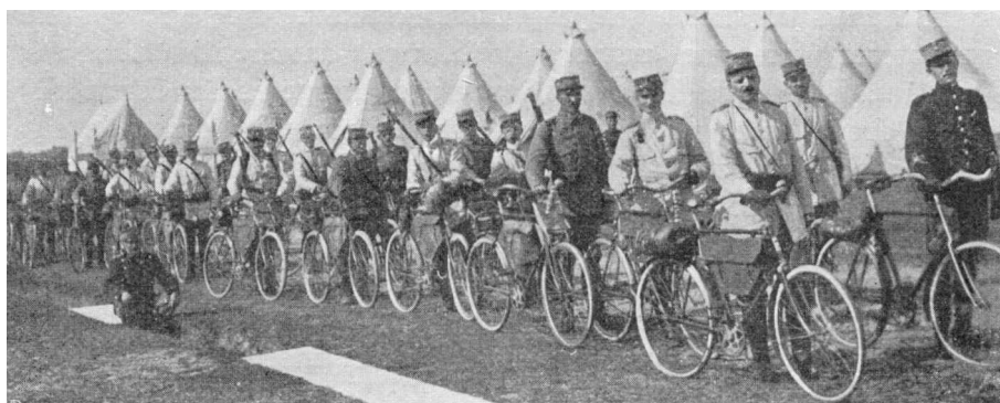
Fra lejren ved Borris.

Vejle Amts Rekyllkorps blev oprettet 13. august 1911 og var da på 52 mand; i 1919 var styrken på 73 mand (inklusive en reservestyrke, som blev oprettet i 1914).